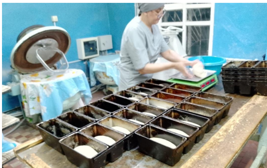
Пекарня ИП Мальцевой ЕО