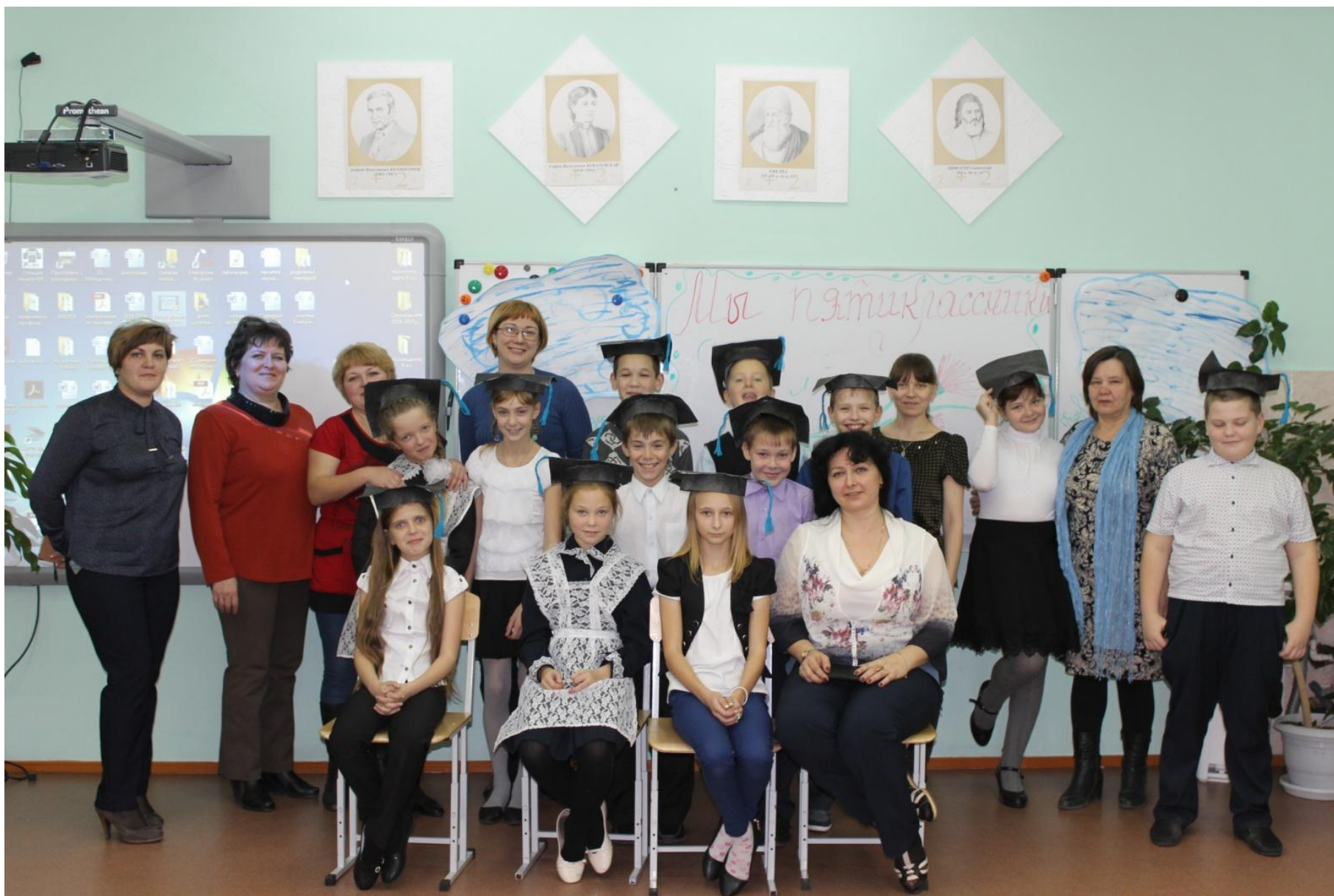
Праздник с родителями