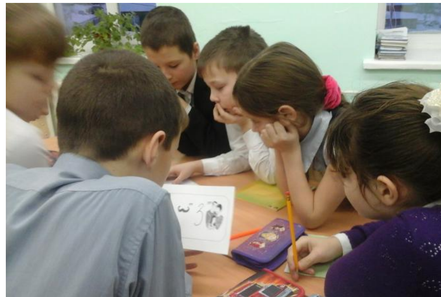
Игра "Я и моя команда"