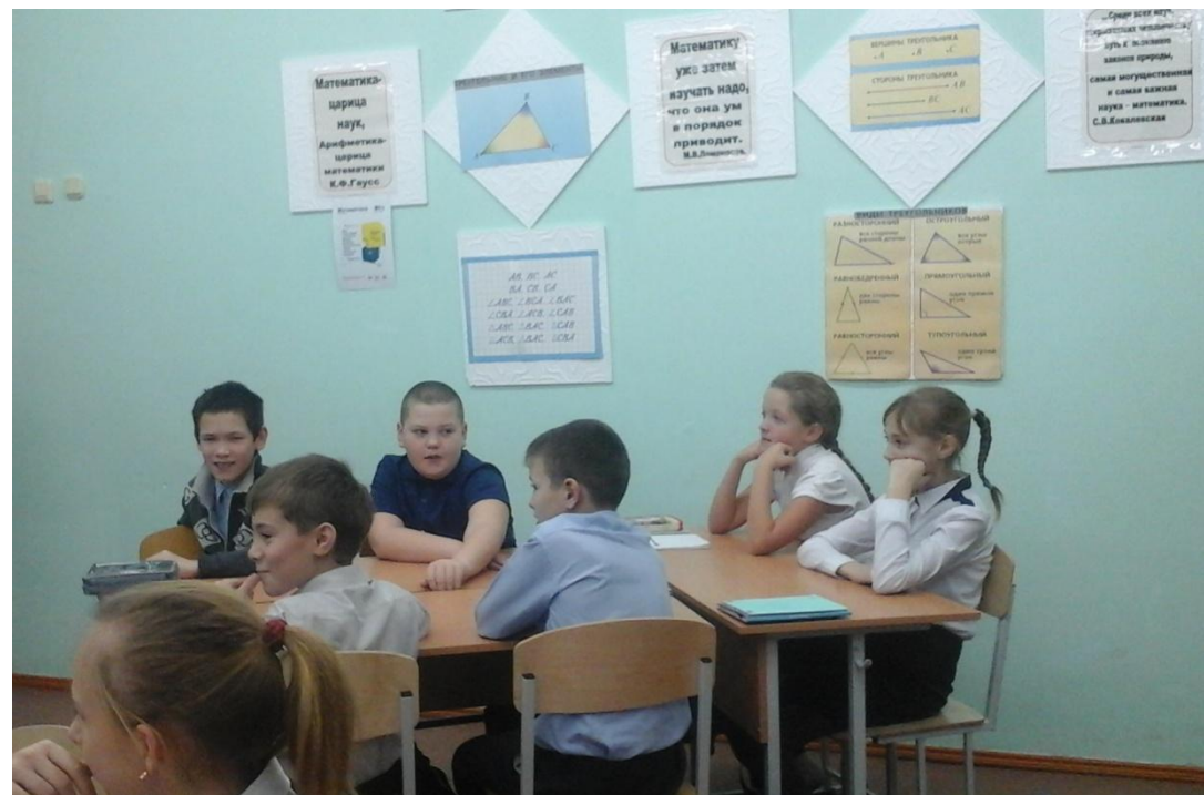
Тест "Кто такой лидер?"

Современный этап развития общества, с одной стороны, характеризуется значительными преобразованиями в социально – экономической жизни России, с другой - кризисными явлениями в системе воспитания, которые привели к снижению уровня нравственности, дегуманизации ценностей и норм поведения определенной части молодежи. Одной из причин такого положения дел, безусловно, является сложная социальная ситуация. Известно, что черты гражданской личности закладываются в детском, подростковом, юношеском возрасте на основе опыта приобретаемого в семье, школе, социальной среде и формирует в дальнейшем всю жизнь человека. Основу гражданственности закладывает сфера свободного времени, являющееся важнейшим фактором социализации личности, формирование ее социальной, асоциальной или антисоциальной направленности.