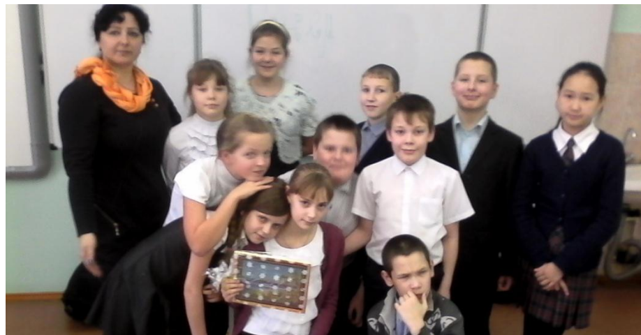
Победители и призеры Международного конкурса