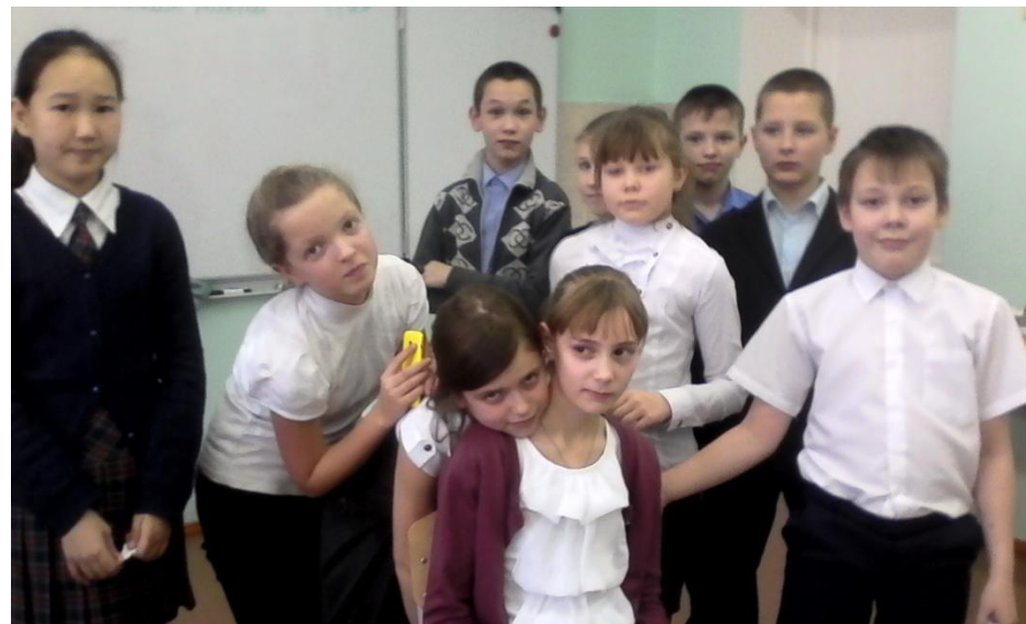
"Лидер и доверие"