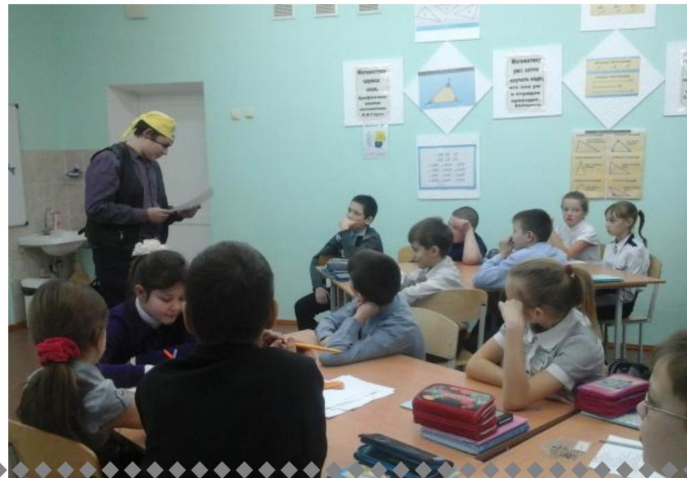
Урок игра "Формула счастья"