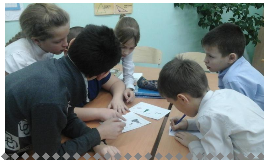
Занятие "Разбуди в себе лидера"

особенности возрастной группы обучающихся. Программа разработана для обучающихся 5-8 классов. И именно в возрасте 11-15 лет происходят интенсивные и кардинальные изменения в организации